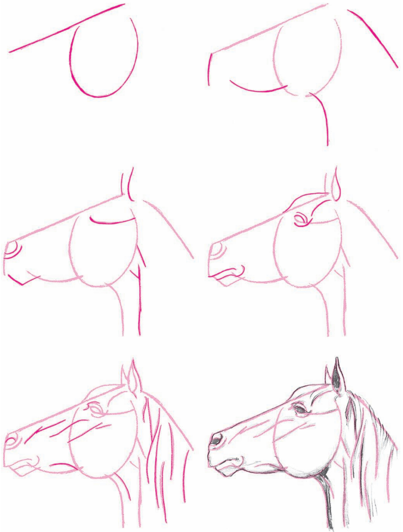
МОРДА ЛОШАДИ В ПРОФИЛЬ