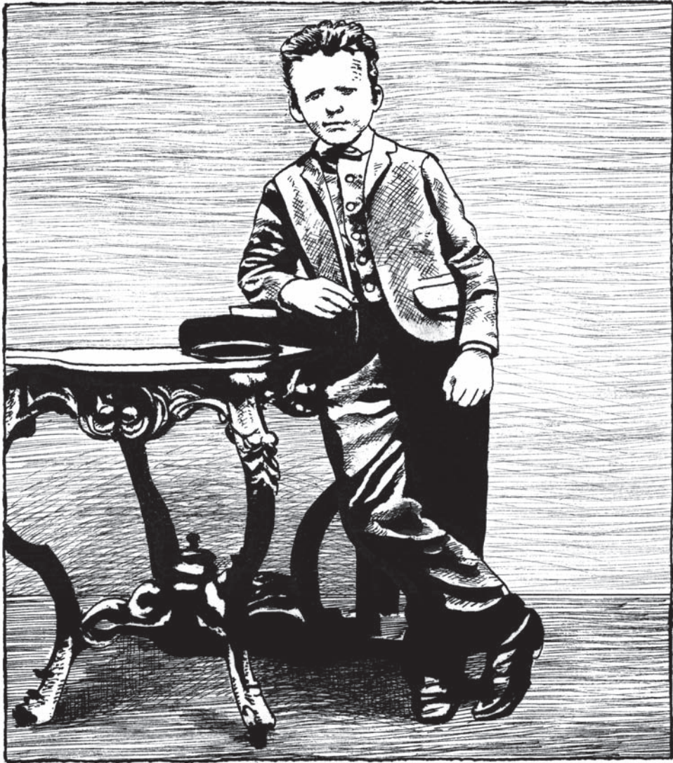
ТЕО В ДЕТСТВЕ

Винсент — ребенок непослушный и обидчивый, у него часто случаются припадки гнева, которые надолго запоминаются. Он тяготеет к одиночеству и при каждом удобном случае уходит подальше от дома и деревни, на пустырь, к каналам. Природа — его утешительница. Мальчик ищет жуков и собирает их в банку. Это его главная страсть — сомнений нет.